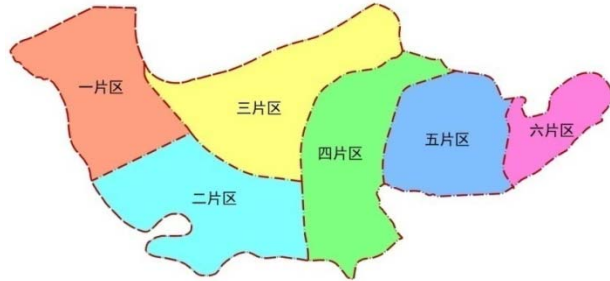
图3 东西湖区城市发展区命名范围分区