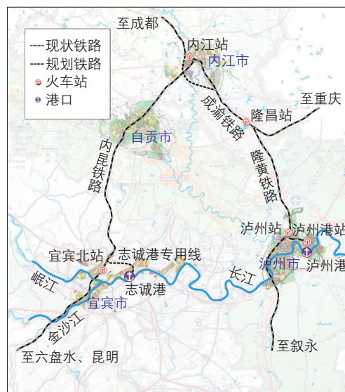
图3 宜宾港、泸州港铁水联运

作为“钻石结构” [14] 的四个核心城镇群之一,以成都、重庆为核心的成渝城镇群是全国经济新的引擎和增长极。川渝两省市在未来产业发展方面制定了宏伟计划 [15-16] ,制造业的大量原材料和产品运输需要多方式物流系统的支撑。2010年以前重庆外贸运输主要通过江海联运,近年来中欧班列的开通和重庆机场的快速发展,使得重庆进出口贸易的运输方式向江海联运、铁水联运、水水中转、航空等多种方式发展。泸州港、宜宾港快速增长的集装箱量与成德绵地区、川南地区制造业的需求增长关系密切。云贵川等上游地区的大宗散货,如矿建材料、非金属矿石、机械设备等,其水运需求也稳中有升。例如,2014年初,宜宾港开始承运中国南车资阳机车有限公司的整车和零部件的江海联运。比起经湛江、防城港的铁水联运或全程陆上运输,云南地区货物通过宜宾港走水陆